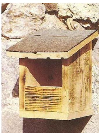
Nichoir à rouge-gorge

Et n'oubliez pas qu'été comme hiver les oiseaux ont besoin d'eau, si vous n'avez pas de mare ou de bassin, installez des abreuvoirs, toujours remplis, à différents endroits de votre jardin. Lorsqu'il gèle, il vous faudra changer l'eau tous les jours, aux heures les plus chaudes de la journée. Les oiseaux s'apercevront très vite qu'à une certaine heure de la journée, toujours la même, l'eau n'est plus gelée... N'ajoutez rien dans l'eau, ni glycérine, ni alcool.