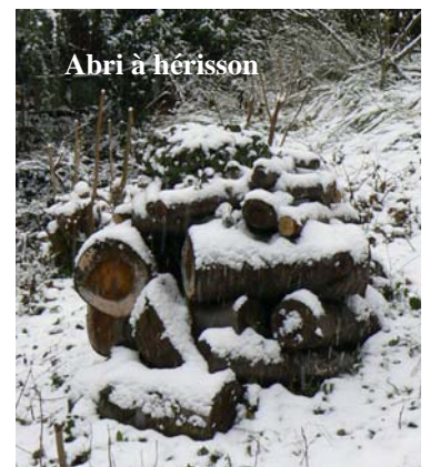
Abri à hérisson

Attirez-le dans votre jardin en lui offrant des abris que vous ne toucherez pas de tout l'hiver : un gros tas de feuilles sèches, de paille, d'herbes coupées, de brindilles que vous entassez au fond du jardin, sous un arbuste, derrière une planche, dans votre cabane de jardin... Il appréciera aussi un tas de bois avec des cavités accessibles et des feuilles ou de la paille à côté.