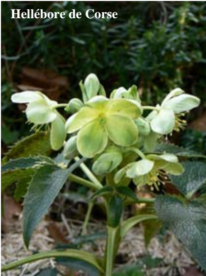
Hellébore de Corse

surtout pas à ceux qui fleurissent au printemps (lilas, forsythias, rosiers non remontants...) Bouturez tout ce que vous taillez.