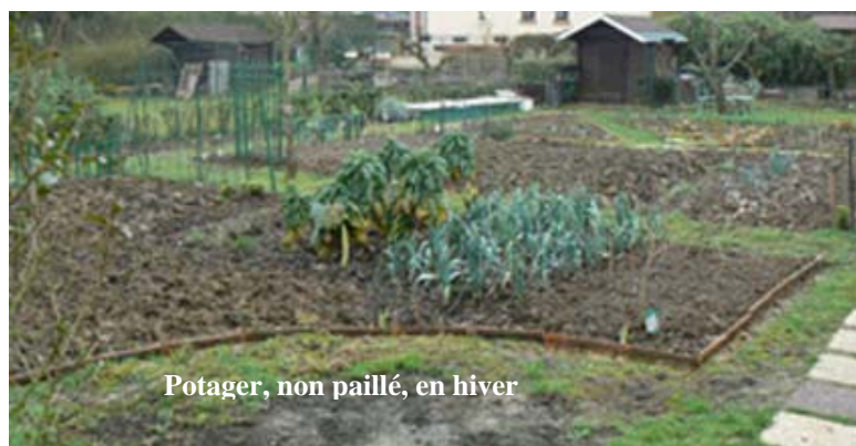
Potager, non paillé, en hiver

Monique Wachthausen jardiniersdefrance91@free.fr