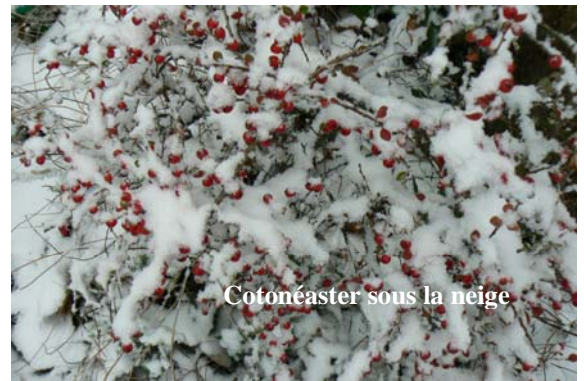
Cotonéaster sous la neige

Cette fois-ci c'est bien vrai, nous sommes en hiver et, le jour le plus court étant passé, ceux qui viennent vont rallonger. Nous n'avons pas encore vu la neige, dans notre Ile de France, mais nous l'espérons pour bientôt, car elle est très utile au jardin. Beaucoup de plantes ont besoin du froid pour mieux pousser au printemps. Les bisannuelles telles les laitues, les betteraves, les endives, les carottes, les giroflées, les pensées, les myosotis, les pâquerettes... réclament deux mois entre 3° et 6 ° pour pouvoir fleurir et donc se reproduire. C'est le cas aussi des graines pour qui le froid, pendant 1 à 3 mois, lève leur « dormance » au printemps : noisetiers, hêtres, sapins, pommiers et poiriers. D'autres vont demander des périodes de froid encore plus longues, de 4 à 6 mois : le frêne, l'érable, le noyer... C'est pourquoi lors d'hivers trop doux ces graines ne germent pas.